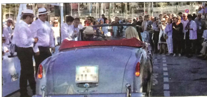
Les parades ont permis au public, venu en nombre, d'admirer les voitures d'exception de vendredi à hier.

Le concours d'État a attribué la première place à la Stanley modèle R 1910, la Lancia Astura Cabriolet Pinin Farina 1937, la Buggatti 57C Atalante (catégorie authentique), la Mercedes 280 SL Pagode. L'élégance est revenue à la Buggatti type 13 1913, la Delahaye 135 M Pourtout 1937 et la Delahaye 135 M carrosserie Figoni et Falaschi. Le coup de cœur du jury a été décerné à la Buick Eight Roadmaster Sedanet 1947.