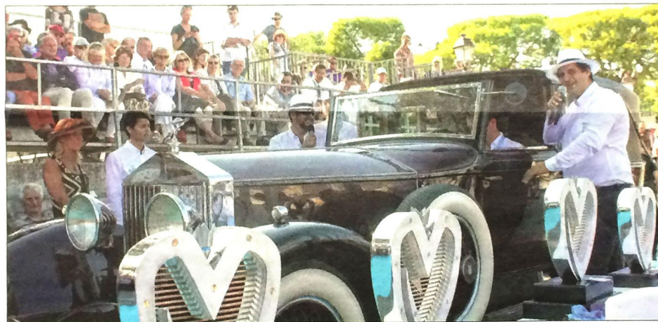
L'édition 2015 est montée en puissance avec le choix de voitures de collection de prestige.

La rencontre entre les passionnés ou les simples amateurs d'automobiles de rêve et d'exception ne pouvait trouver meilleur écrin que celui du port de plaisance! Par une manifestation d'exception de belles mécaniques chargées d'histoire et d'émotions, la ville de Saint-Jean-Cap-Ferrat a réussi son second pari de entre vendredi et hier avec le Saint-Jean-Cap-Ferrat Légendes. L'édition 2015 est montée en puissance par le choix des voitures. « L'automobile et les hommes sont depuis des lustres devenus indissociables », précise Jean-François Dieterich le maire. « Notre territoire, site classé, offre une parfaite vi-